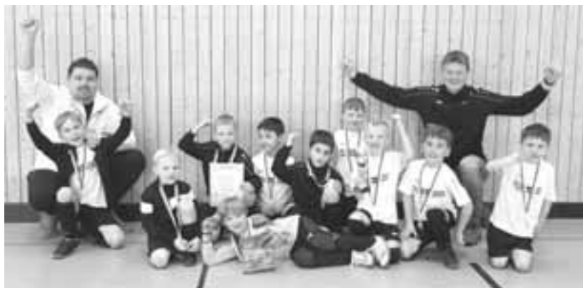
U8 beim Turniersieg in Güntersleben