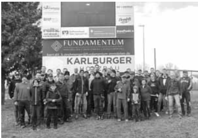
Helfer des „Frühjahrsputzes“ 2024

Vielen herzlichen Dank an alle Helfer für ihren Einsatz an diesem Tag sowie unsere Metzgerei Hartmann für die Übernahme der Brotzeit.