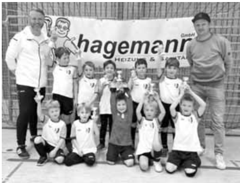
U7 beim Turniersieg in Burgsinn