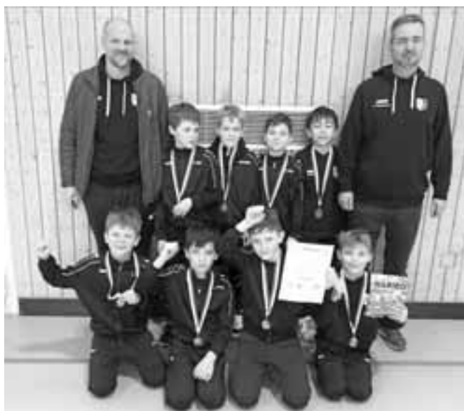
U10 beim Hallenturnier in Güntersleben