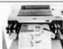
SETZ & LAYOUT