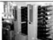
SCHNEIDEN, FALZEN & BINDEN