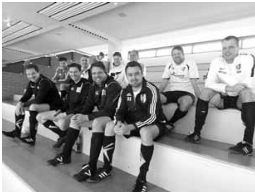
Dreikönig Hallenturnier in Hammelburg