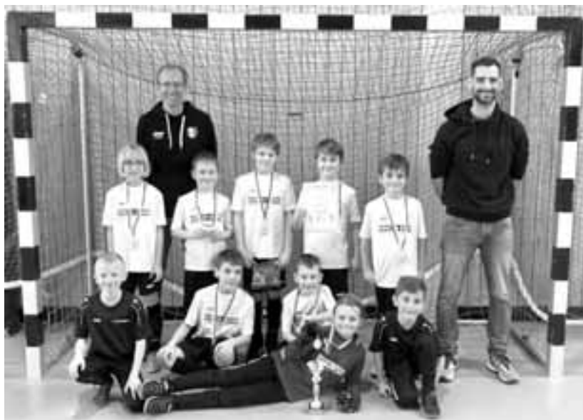
U9 beim Turniersieg in Güntersleben